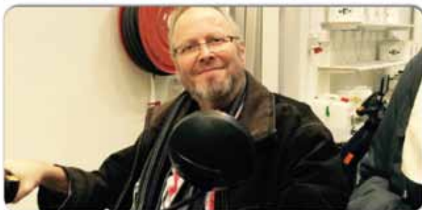
Besøg på hjælpemiddelcentralen