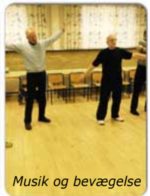
Musik og bevægelse