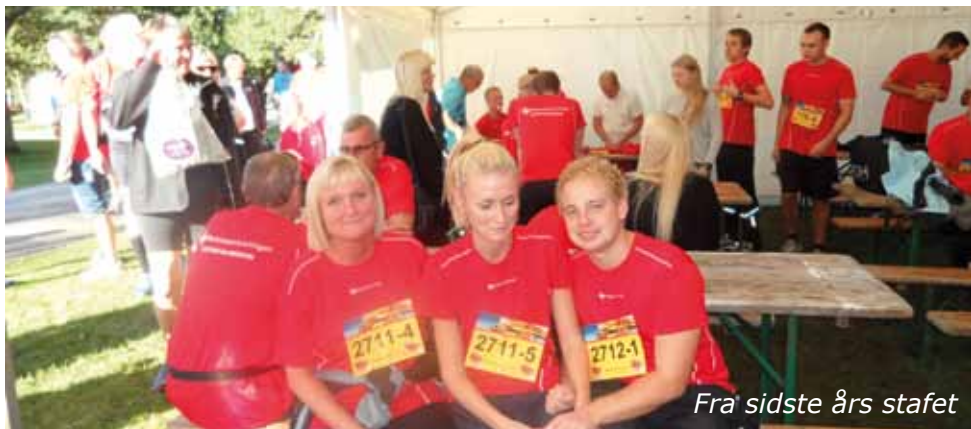
Fra sidste års stafet

Fornavn, efternavn, distance (gå eller løb km) og ønsket trøjestørrelse.