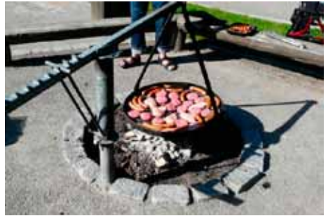
Grill sortimentet, det var godt.