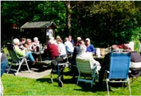
Hygge på pladsen

Vi havde en rigtig hyggelig dag, og snakken gik til ved aftenstide, hvor trætheden så begyndte at melde sig. Vi har allerede besluttet, at vi vil gentage det på samme sted næste år, da det fungerer helt optimalt.