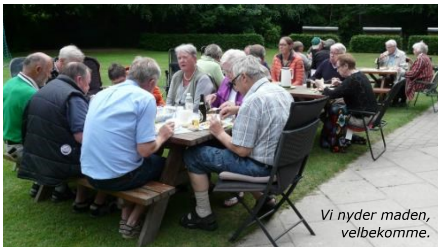
Vi nyder maden, velbekomme.

Klubben var atter i år vært med maden, og drikkevarerne var som vanligt for egen regning til købmandspris. Og fælleden i Hundeleve er et oplagt sted at holde grill-fest på, det fungerer simpelthen så godt. Så det bliver også stedet til 2017, regner vi med.