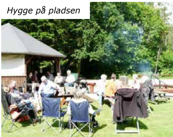
Hygge på pladsen

Vi endte op med 22 deltagere, og havde en rigtig hyggelig dag. Snakken gik fint, og der var da også nye ansigter iblandt deltagerne. Dejligt, at vi kan lokke dem med. Der var forskellige lækre ting til grillen, samt dejlig kartoffelsalat og blandet grøn salat. Og der var rigeligt med mad til alle.