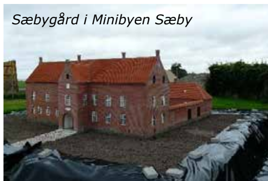
Sæbygård i Minibyen Sæby

Fra 'Minibyen Sæby' kørte vi videre til Aalbæk Gl. Kro, hvor der ventede os en lækker frokost. Vi havde bestilt stedets 'Kroplatte', men den havde