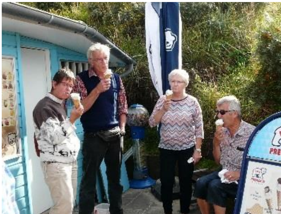
Dessert i Tversted

blomstrer. Vi gjorde stop ved den lille Råbjerg Kirke, hvor vores store danske sanger og tenor baryton, Axel Schiøtz, ligger begravet. Vi fandt hans gravsten, men desværre var kirken aflåst.